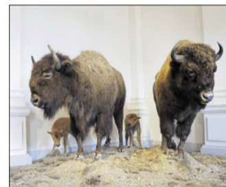
Blutsbrüder: Das Museumsquartier in Osnabrück widmet sich dem Mythos um Karl May.

führen wie Homers Odysseus längst ein Leben außerhalb der Bücher – für Neuhaus ein Ausweis großer künstlerischer Qualität, ja Einmaligkeit.